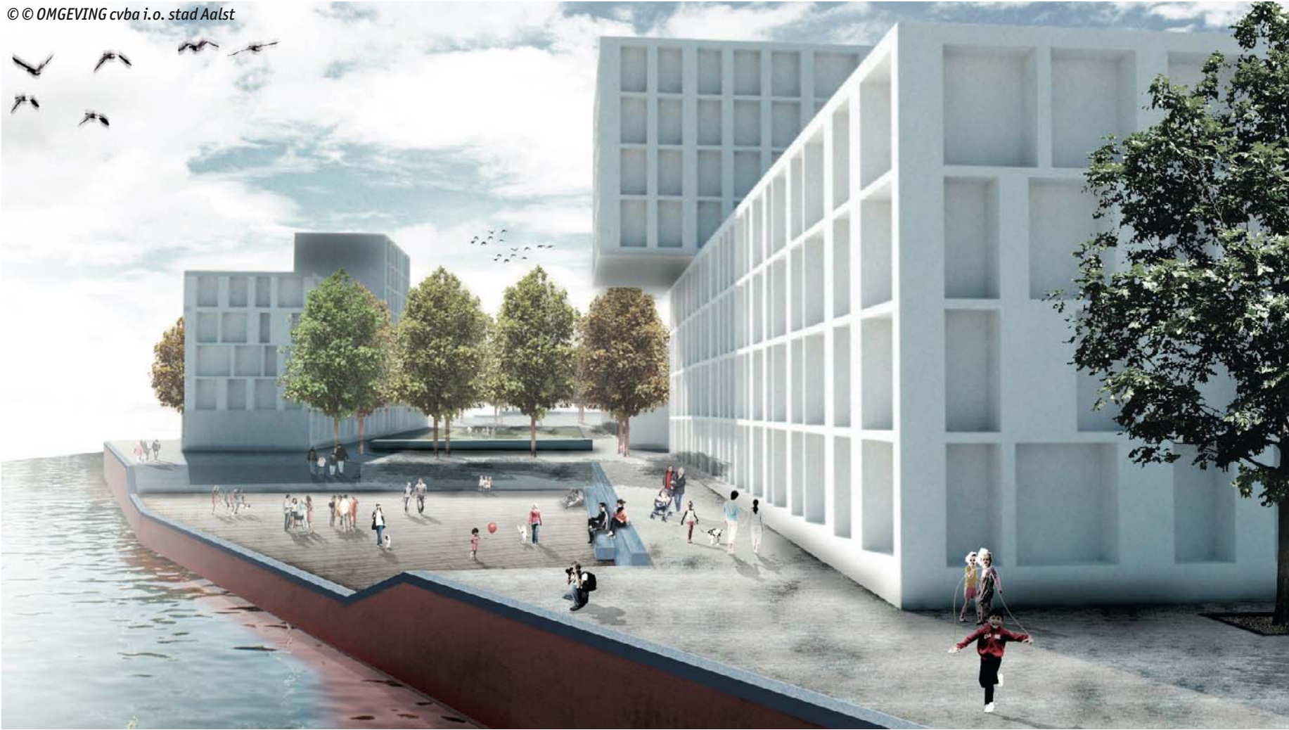
■ De Denderkade wordt een aantrekkelijk gebied om te wonen en te vertoeven.