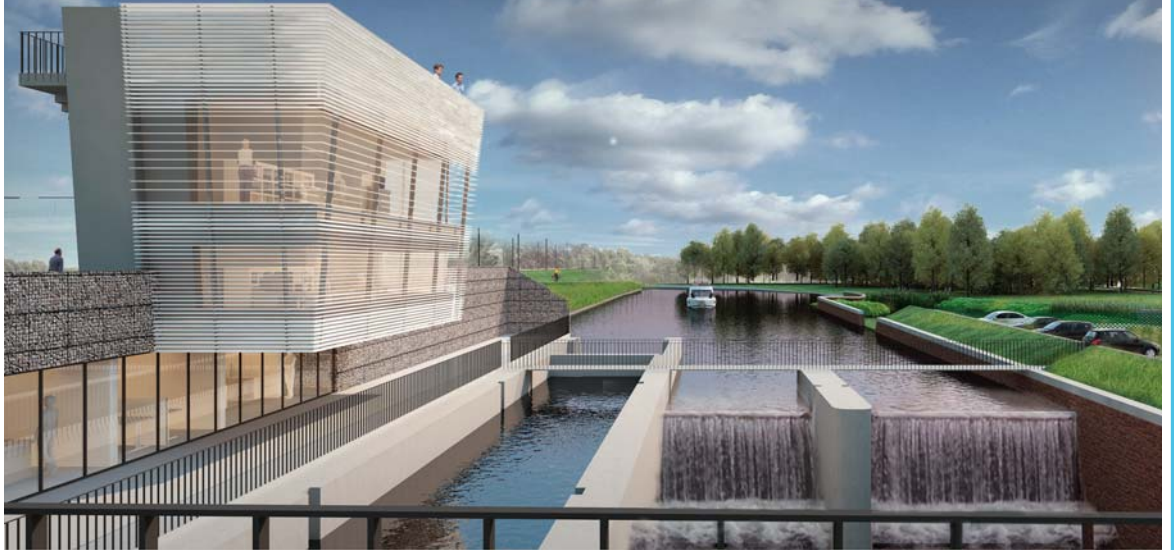
Vanop de stuwsluis kan je uitkijken over de groene omgeving

Met een volledig nieuwe, hypermoderne stuwsluis wil Waterwegen en Zeekanaal NV alle knelpunten in één klap oplossen. De nieuwe infrastructuur laat een betere waterbeheersing toe en is er op maat van de beroeps- en pleziervaart. Naast de sluis komt een aparte geul voor vissen en is er ruimte voor recreatie. De nieuwe