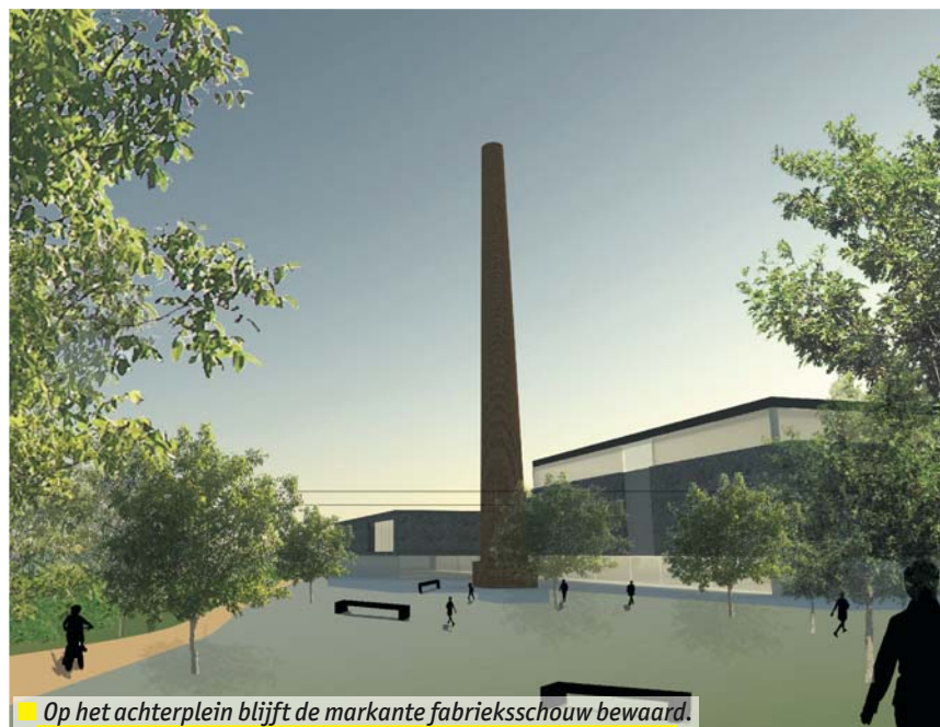
Op het achterplein blijft de markante fabrieksschouw bewaard.

De stad bouwt het sportcentrum op de site van de voormalige leerlooierij Schotte. De nieuwe site biedt ruimte aan een sporthal (70x45,50 meter), een turnhal (30x45 meter), een gevechtssportzaal (23x14 meter), een danszaal (23x14 meter), een polyvalente vergaderzaal, een horecaruimte, een sauna en een fitnessruimte. Ook de administratie van de Sportdienst vindt er onderdak. Er komt ook een aparte ruimte waar scholen en erkende sportverenigingen sportmateriaal kunnen ontlenen. De firma Cordeel tekende voor het winnende ontwerp en zal de werken uitvoeren. Het project wordt deels gesubsidieerd door de Vlaamse overheid. Eens de stad over de stedenbouwkundige vergunning beschikt kan de bouw na het bouwverlof in augustus starten.