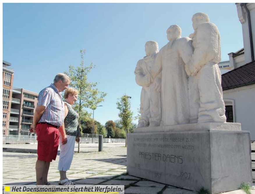
Het Daensmonument siert het Werfplein.

Wie er liever niet alleen op uittrekt kan zich inschrijven voor een gratis wandeling. Een gids leidt op zondagen 1 juni, 6 juli, 3 augustus en 7 sep-