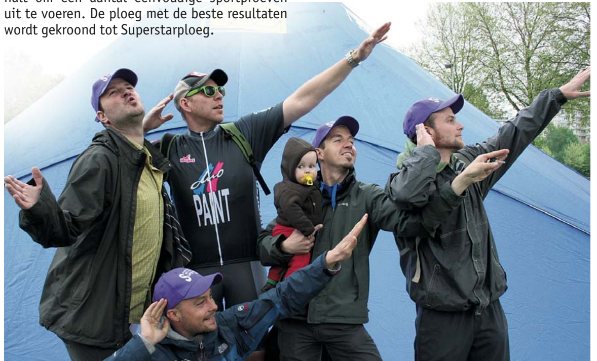
Geniet samen met vrienden en familie van een gezellige sportdag tijdens Superstar op Wielen.

De succesformule van Superstar op Wielen is niet gewijzigd. Groepjes van minimaal 5 personen vertrekken tussen 10 en 13 uur aan het Sportcentrum Osbroek voor een tocht van 25 of 45 km. In de deelgemeenten houden de fietsers halt om een aantal eenvoudige sportproeven uit te voeren. De ploeg met de beste resultaten wordt gekroond tot Superstarploeg.